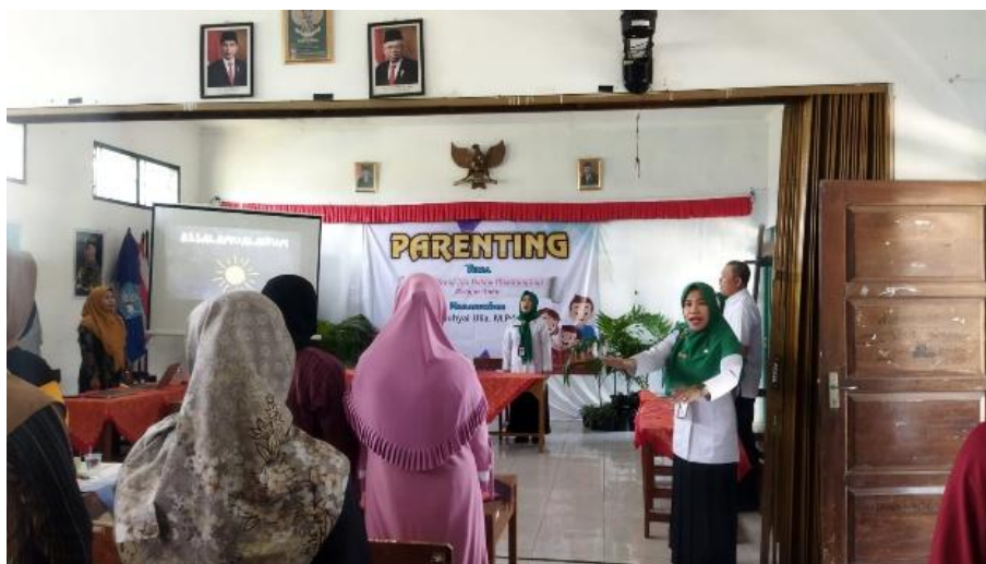
Gambar 5. Kegiatan Pengabdian

Proses pendampingan yang partisipatif ini tidak hanya sekadar memberikan teori, melainkan langsung menyentuh akar permasalahan dengan mengedukasi orang tua untuk mengenali modalitas belajar anak mereka masing-masing. Hasil nyata dari kegiatan pengabdian ini menunjukkan adanya peningkatan pemahaman yang sangat krusial pada diri orang tua mengenai esensi dari Learning Style Strategy. Orang tua kini tidak lagi memaksakan metode belajar yang seragam, melainkan telah mampu mengidentifikasi serta memetakan secara mandiri apakah anak mereka cenderung memiliki gaya belajar visual, auditori, atau kinestetik. Peningkatan pemahaman ini membawa dampak domino yang positif terhadap kualitas interaksi belajar di rumah. Ketika orang tua mengetahui bahwa anak mereka adalah seorang pembelajar visual, mereka mulai menyediakan media belajar bergambar. Begitu pula saat menghadapi anak dengan gaya belajar auditori atau kinestetik, orang tua dapat menyesuaikan strategi pendampingan dengan metode mendengar atau melibatkan aktivitas fisik yang relevan.