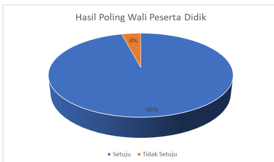
Gambar 3. Hasil Poling

Tahap ini bertujuan untuk membangun hubungan awal, menyamakan persepsi, dan mengajak partisipasi aktif pihak sekolah dalam program yang akan dijalankan. Hasilnya pihak sekolah menyambut baik program ini. Terbentuk kesepakatan bersama mengenai pentingnya keterlibatan orang tua dalam mengenali gaya belajar anak, serta komitmen mereka untuk menghadiri seluruh rangkaian kegiatan hingga selesai. Dari hasil kegiatan pada tahap sosialisasi awal diperoleh tanggapan positif dari pihak sekolah yaitu kepala sekolah, guru sekolah dan komite sekolah akan diselenggarakannya kegiatan pengabdian melalui parenting. Mereka menganggap kegiatan ini bisa memberikan dampak positif bagi orang tua dalam pendampingan belajar. Hal ini sejalan dengan pendapat (Laili, 2025) yang menyatakan bahwa proses pendampingan serta peran aktif orang tua ketika mendampingi anak akan menentukan besarnya manfaat dan makna yang diperoleh dalam aktivitas belajar di rumah. Sebagai bentuk audiensi diberikan poling ke wali siswa terkait rencana kegiatan pengabdian dan diperoleh hasil seperti gambar grafik berikut: