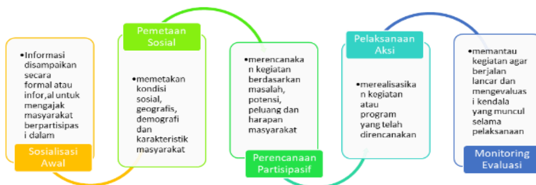
Gambar 1. Tahapan Pelaksanaan Pengabdian Masyarakat