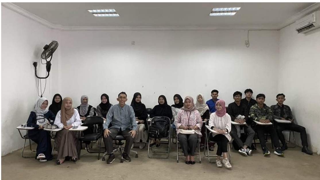
Gambar 3. Foto Bersama Setelah Evaluasi Hasil Draft Artikel Ilmiah Peserta

Untuk mengukur efektivitas kegiatan pendampingan, dilakukan perbandingan hasil pre-test dan post-test sebagaimana disajikan pada tabel 2 di bawah ini: