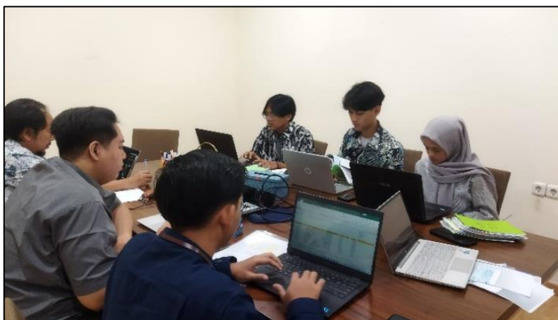
Gambar 1. Vouching Transaksi pada Kas dan Bank

Vouching merupakan prosedur audit yang dilakukan untuk memverifikasi keaslian dan validitas suatu transaksi yang tercatat dalam laporan keuangan dengan menelusuri kembali ke dokumen sumber atau bukti fisik yang mendasarinya (Putri & Sulistyowati, 2023). Vouching dilakukan dengan memeriksa dokumen pendukung untuk setiap transaksi yang tercatat dalam kas dan bank. Tujuannya adalah untuk menilai keabsahan dan ketelitian pencatatan transaksi tersebut. Melalui vouching, auditor memastikan bahwa bukti pendukung yang digunakan telah lengkap, jumlah yang dicatat sesuai dengan nilai sebenarnya, serta konsisten dengan mutasi rekening perusahaan.