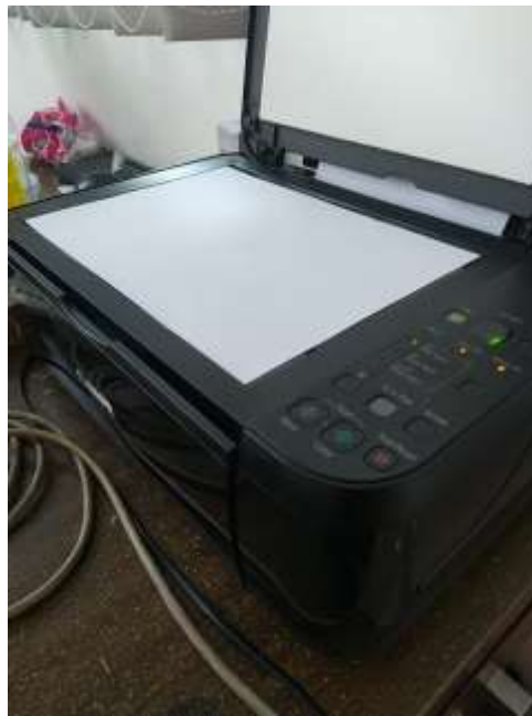
Gambar 5. Mengscan Berkas