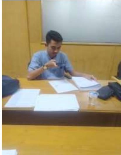
Gambar 3. Memverifikasi Bukti Transaksi Pengeluaran dan Penerimaan Kas Klien

Pada proses ini mahasiswa melakukan pengecekan otorisasi dan memvalidasi apakah bukti transaksi yang ada pada soft file sesuai dengan kwitansi dan jumlah ril penerimaan dan pengeluaran kas klien.