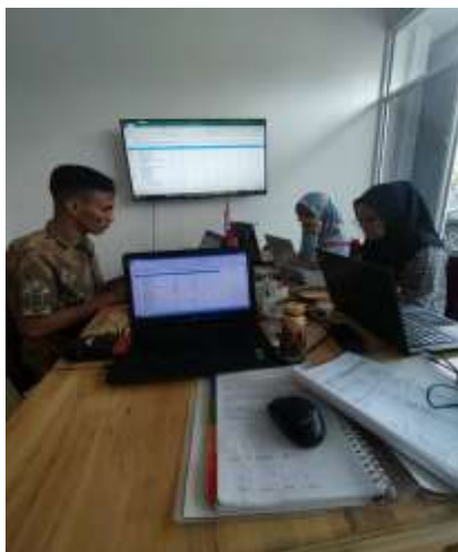
Gambar 4. Membuat CoA (Chart of Account)

Pada tahap ini mahasiswa membuat Jurnal CoA yang terdiri dari nomor akun, nama akun, keterangan hingga nominal yang didasarkan dari data atau bukti transaksi yang telah di berikan oleh klien kepada KAP Boy Febrian.