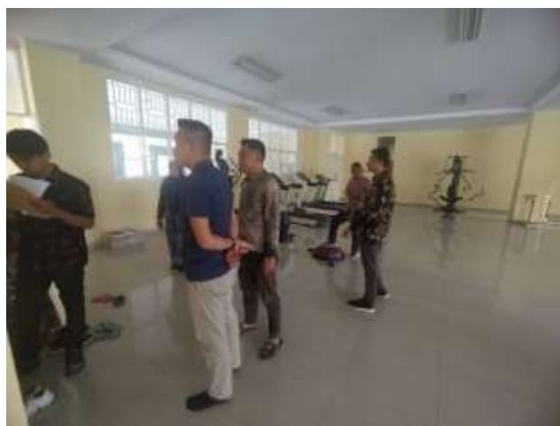
Gambar 2. Memverifikasi Aset Klien

Pada proses ini mahasiswa langsung terjun ke lapangan untuk melakukan pengecekan dan memvalidasi apakah aset yang ada di lapangan sesuai dengan laporan aset yang telah di dibuat oleh klien. Apabila ada suatu temuan ataupun ketidaksesuaian pada saat verifikasi aset, maka laporan asetnya akan ditandai terlebih dahulu dan nantinya para auditor akan menindak lanjutinya.