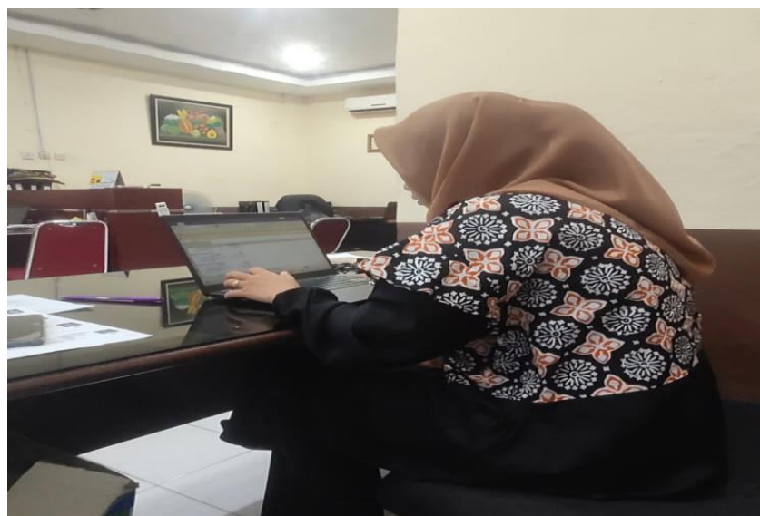
Gambar 2. Menginput ppn-in di aplikasi e-faktur

Aktivitas yang dilakukan sebagaimana disajikan pada gambar 2 dibawah ini