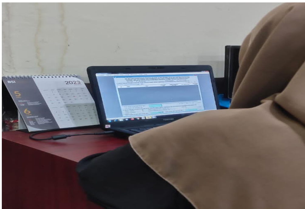
Gambar 6 . Pelaporan dan perhitungan pph 23

Aktivitas yang dilakukan sebagaimana disajikan pada gambar 3 dibawah ini