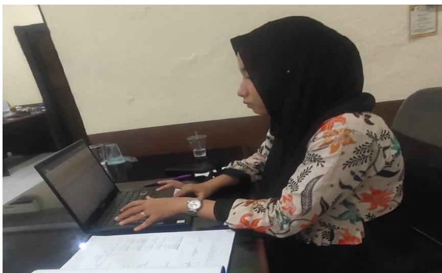
Gambar 8. Membuat purchase order