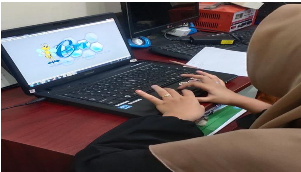
Gambar 5. Pelaporan dan perhitungan pph 21

Aktivitas yang dilakukan sebagaimana disajikan pada gambar 5 dibawah ini