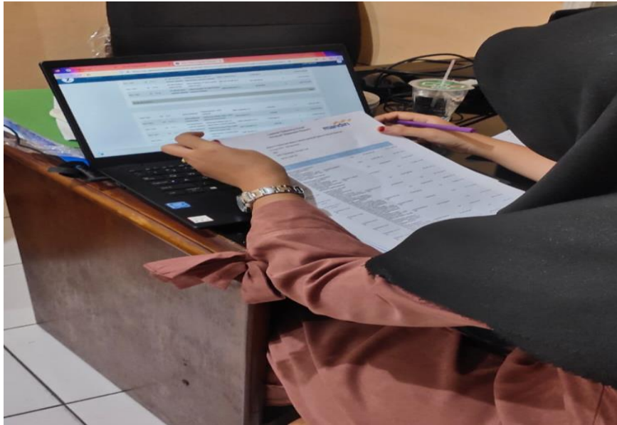
Gambar 4 - Pengecekan dan pengarsipan dokumen voucher