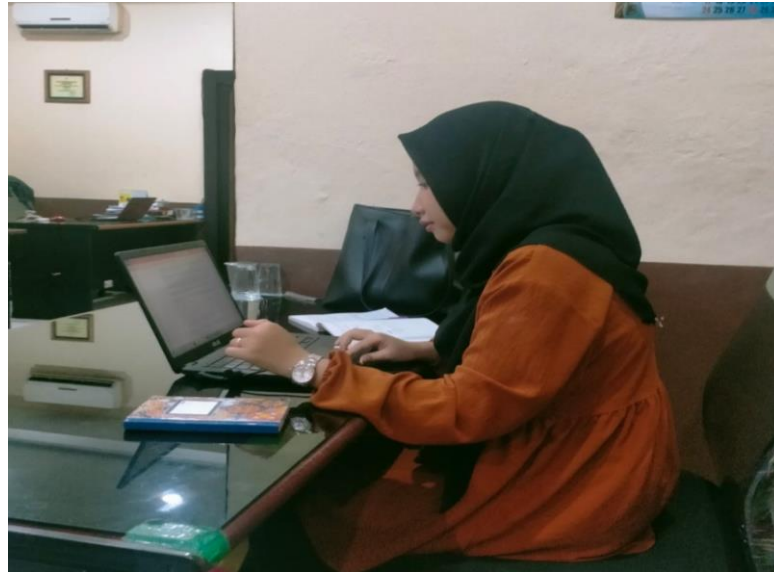
Gambar 1. Menginput Faktur pembelian pada web Zahir Accounting