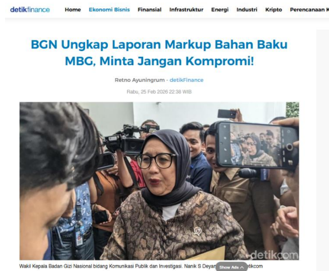
Gambar 3. Cover Berita 3 dalam Detik.com