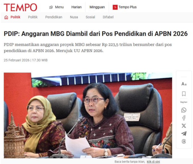
Gambar 5. Cover Berita 2 dalam Tempo.co