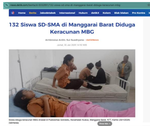
Gambar 1. Cover Berita 1 dalam Detik.com