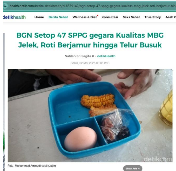
Gambar 2. Cover Berita 2 dalam Detik.com