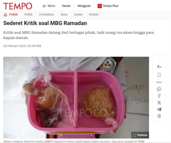
Gambar 4. Cover Berita 1 dalam Tempo.co