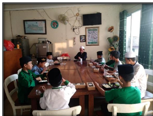
Gambar 2. Kedisiplinan dan Kebersamaan Santri

Dari sisi sosial, pesantren ini juga berfungsi sebagai pusat pemberdayaan masyarakat sekitar. Program “Santri Mengajar” dan “Pesantren Peduli” melibatkan santri dalam kegiatan dakwah, pendidikan nonformal, dan kebersihan lingkungan. Aktivitas ini menjadikan pesantren sebagai institusi sosial yang berkontribusi pada pembentukan moral masyarakat.