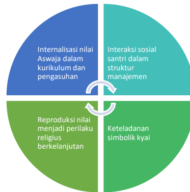
Gambar 2. Model Konseptual Pembentukan Habitus Keislaman Santri Discussion

Secara keseluruhan, hasil penelitian ini menunjukkan bahwa manajemen pendidikan berbasis Aswaja di Pondok Pesantren Yatim NU Karawang berhasil menciptakan sistem pendidikan yang menyatukan aspek nilai, struktur, dan praktik. Sistem tersebut tidak hanya mendukung keberhasilan akademik santri, tetapi juga menghasilkan habitus keislaman yang mencerminkan keseimbangan antara spiritualitas dan tanggung jawab sosial. Model strategi manajemen pendidikan yang diterapkan dapat dilihat pada gambar 1 di bawah ini: