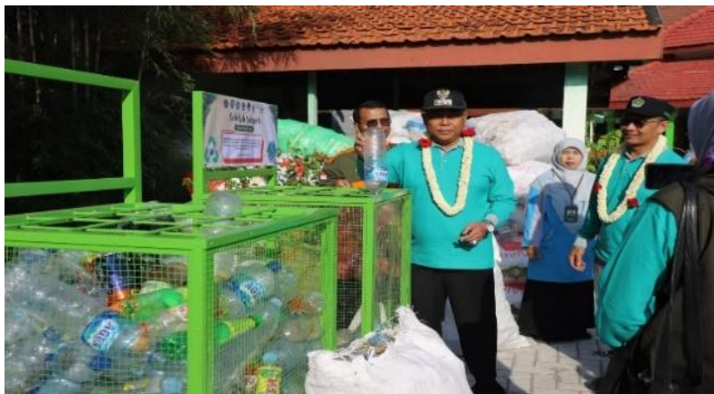
Gambar 1. Penerapan Awal Inovasi Gema Sajadah di MTsN 11 Jombang

Inovasi program Gema Sajadah dirancang dengan mekanisme yang sederhana namun berdampak luas, yakni melalui gerakan memilah sampah di madrasah dengan melibatkan siswa, guru, dan orang tua. Konsep utama Gema Sajadah adalah pemanfaatan sampah sebagai sumber daya alternatif yang dapat dikelola oleh madrasah bersama warga sekolah dan masyarakat. Sampah yang dikumpulkan siswa maupun wali murid tidak hanya berfungsi sebagai pendidikan karakter peduli lingkungan, tetapi juga menjadi salah satu sumber pendanaan tambahan bagi madrasah. Mekanisme pengelolaan dilakukan dengan sistem kerja sama antara madrasah, masyarakat, Dinas Lingkungan Hidup, serta Bank Sampah Induk Jombang. Sampah yang telah dikumpulkan akan disalurkan ke bank sampah untuk kemudian dibeli dan dikelola secara lebih profesional, sehingga program ini mampu melibatkan multi-aktor dalam proses pelaksanaannya. Sebagaimana wawancara dengan pengelola utama inovasi gema sajadah.