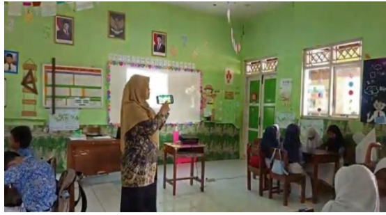
Gambar 5. Stimulasi

Gambar 5 menggambarkan guru sedang menampilkan aplikasi Tina Adventure sebagai media pembelajaran sembari membimbing siswa mengoperasikannya. Guru menjelaskan fitur aplikasi tujuan pembelajaran, menu permainan, materi pola lantai tari kreasi daerah, serta video contoh seperti Jepin Selendang untuk membantu siswa memahami desain karya tari Jepin Empat-Empat. Siswa diarahkan untuk mengamati pola desain dan ragam gerak, mendiskusikan tarian daerah melalui video, lalu mengerjakan tugas dengan pertanyaan pemantik ("Jenis pola lantai apa di video?"), sebagai tahap stimulasi discovery learning untuk tumbuhkan rasa ingin tahu dan tanggung jawab.