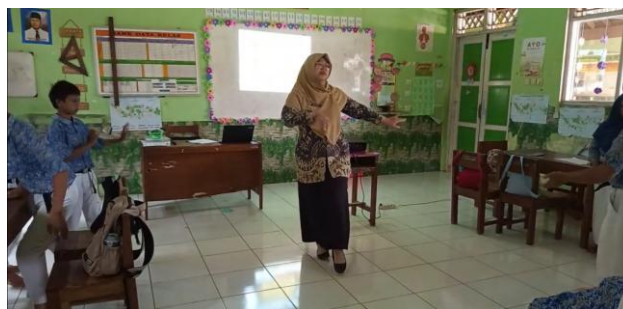
Gambar 8. Pengolahan Data

Setiap kelompok melakukan diskusi untuk mengevaluasi dan menafsirkan data yang telah mereka kumpulkan sebelumnya. Setelah itu, peserta didik mulai mencoba mempraktikkan gerakan yang mereka temukan melalui aplikasi, lalu mengembangkan atau mengombinasikannya menjadi rangkaian gerak baru sesuai dengan hasil eksplorasi mereka. Secara kolaboratif, kelompok menyusun konsep desain formasi untuk karya tari tradisional Jepin Selendang , dengan fokus pada ragam gerak Jepin Empat-Empat , berdasarkan hasil pengamatan serta pemahaman yang diperoleh melalui proses diskusi. Selama kegiatan berlangsung, guru berperan aktif dalam memandu jalannya diskusi kelompok dan memberikan contoh konkret mengenai bentuk gerakan empat-empat , seperti yang ditampilkan pada Gambar