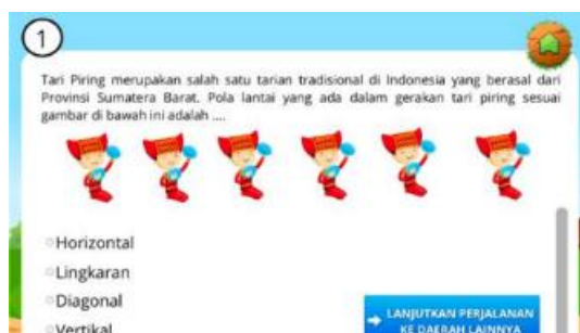
Gambar 4. Soal Kognitif

Hasil observasi dan wawancara ditemukan bahwa sebelum pembelajaran dimulai implementasi multimedia interaktif Tina Adventure dibuka dengan berdoa, guru melakukan ice breaking , cek kehadiran, membagi siswa menjadi beberapa kelompok, serta memberikan penjelasan mengenai tujuan pembelajaran. Guru memantik rasa ingin tahu melalui pertanyaan ("Apa itu tari tradisional?") dan menunjukkan salah satu video Tari Jaranan Banyumas.