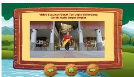
Gambar 3. Praktik Gerakan Tari