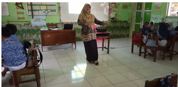
Gambar 10. Penarikan Kesimpulan

Berdasarkan Gambar 10, terlihat guru bersama siswa secara aktif melakukan kegiatan merangkum dan menyimpulkan materi pembelajaran yang telah dipelajari, khususnya terkait konsep desain kelompok dalam tari tradisional Jepin Selendang dengan fokus pada ragam gerak Jepin Empat-Empat . Guru mengajak siswa mengingat kembali informasi yang terdapat dalam aplikasi Tina Adventure dengan bertanya, "Tadi di dalam aplikasi terdapat pola lantai, apa saja yang kalian lihat? Ada pola lantai horizontal yang lurus ke samping, pola vertikal, dan lainnya, bukan?". Selama proses refleksi ini, guru memberikan penekanan pada poin-poin utama yang telah dipelajari, sekaligus memperkuat pemahaman siswa terhadap materi. Guru juga menegaskan pentingnya eksplorasi dalam menari, kerja sama dalam kelompok, serta kreativitas dalam menciptakan bentuk-bentuk gerakan dan formasi tari. Kegiatan ini bertujuan