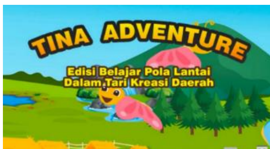
Gambar 2. Eksplorasi Awal