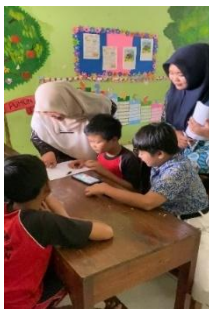
Gambar 7. Pengumpulan Data

Gambar 7 memperlihatkan aktivitas peserta didik saat memanfaatkan aplikasi Tina Adventure untuk mencari referensi gerakan dan pola lantai dalam tari. Siswa melanjutkan pengamatan mereka dengan fokus pada pertanyaan-pertanyaan yang sebelumnya telah disusun bersama dalam kelompok. Setiap kelompok bertugas mengidentifikasi dan mengumpulkan informasi mengenai jenis desain kelompok, seperti formasi serempak, berimbang, silih berganti, selang-seling, spiral, dan lainnya, yang ditampilkan dalam aplikasi. Selain itu, siswa juga diberi kesempatan untuk membuat ilustrasi atau menuliskan deskripsi singkat terkait pola-pola lantai yang telah mereka temukan. Selama proses pengumpulan data berlangsung, guru berkeliling ke setiap kelompok untuk memberikan pendampingan, menjawab pertanyaan, serta membantu menyelesaikan kendala teknis maupun pemahaman yang dihadapi siswa. Kegiatan ini tidak hanya melatih kemampuan eksplorasi dan pengamatan, tetapi juga membentuk sikap tanggung jawab dan integritas peserta didik dalam proses pengumpulan data berbasis digital melalui aplikasi Tina Adventure .