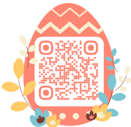
Gambar 1. Aplikasi Tina Adventure

Aplikasi Tina Adventure dapat diakses secara langsung dan mudah melalui scan barcode dibawah ini :