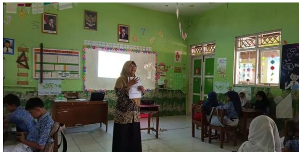
Gambar 6. Identifikasi Masalah

Berdasarkan Gambar 6, tampak guru sedang membagikan lembar kerja yang akan dikerjakan oleh masing-masing kelompok siswa. Setiap kelompok diminta untuk mengisi lembar tersebut dengan terlebih dahulu melakukan pengamatan terhadap materi yang ditampilkan dalam aplikasi. Siswa kemudian diarahkan untuk menganalisis dan menjawab pertanyaan-pertanyaan yang terdapat di dalam lembar kerja tersebut, serta mencatat elemen-elemen desain pola lantai yang mereka temukan dari tampilan aplikasi. Selama kegiatan berlangsung, guru berperan aktif dalam memfasilitasi jalannya diskusi kelompok. Guru juga membimbing siswa dalam merumuskan pertanyaan eksploratif, seperti: "Bagaimana para penari membentuk pola lantai dalam tari Jepin Selendang ragam Jepin Empat-Empat berdasarkan video yang ditampilkan dalam aplikasi?" Setiap kelompok diberi kesempatan untuk menuliskan pertanyaan atau permasalahan yang ingin mereka kaji lebih lanjut. Proses ini tidak hanya membantu siswa dalam memahami materi secara mendalam, tetapi juga melatih keterampilan berpikir kritis, meningkatkan kemampuan bekerja sama dalam kelompok, serta menumbuhkan rasa tanggung jawab dalam menyelesaikan tugas bersama.