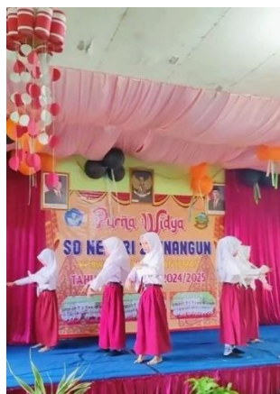
Gambar 12. Pentas Seni Tari

Guru juga secara rutin melakukan monitoring dan evaluasi untuk memastikan siswa tetap fokus dan bertanggung jawab dalam proses belajar. Kemudian, pada saat diluar jam pembelajaran seni tari, siswa kelas V juga mengikuti ekstrakurikuler kenthongan yang didalamnya terdapat tarian yang implementasinya menggunakan pola lantai tari kreasi daerah yang ada didalam aplikasi Tina Adventure . Ekstrakurikuler kenthongan ini dilaksanakan setiap hari Rabu dari jam 13.30-16.00 dimana pada saat latihan siswa selalu berlatih dengan sungguh-sungguh dan terus mengulang gerakan yang mereka pelajari. Hal itu dibuktikan dengan siswa-siswi yang mengikuti ekstrakurikuler kenthongan yang didalam kegiatannya terdapat tarian dari implementasi materi pola lantai tari kreasi daerah, berhasil meraih juara 3 kategori instansi dalam kegiatan karnaval Desa Binangun yang dilaksanakan pada 8 September 2024. Selain itu, berdasarkan gambar 12, siswa mampu menampilkan tarian yang luar biasa dalam acara perpisahan dan pelepasan siswa kelas 6 SDN 2 Binangun yang dilaksanakan pada tanggal 12 Juni 2025.