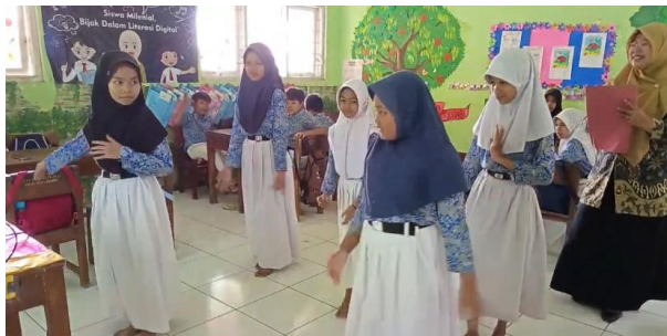
Gambar 9. Pembuktian

Berdasarkan Gambar 9 menampilkan kegiatan presentasi hasil desain formasi tari dari setiap kelompok di depan kelas. Saat satu kelompok menampilkan hasil karya geraknya, kelompok lain turut berpartisipasi dengan memberikan tanggapan dan saran yang membangun. Dalam proses ini, guru berperan aktif membimbing siswa dalam menyampaikan pendapat serta memastikan bahwa ide-ide yang disampaikan selaras dengan konsep tari Jepin Selendang khususnya pada ragam gerak Jepin Empat-Empat . Guru juga memberikan klarifikasi dan memperkuat ide-ide yang dinilai sesuai serta mendukung pembelajaran. Tahapan ini menjadi sarana penting dalam menanamkan sikap berpikir kritis dan rasa tanggung jawab pada siswa, baik dalam menyusun karya maupun saat memberikan masukan terhadap hasil kerja teman kelompok lainnya.