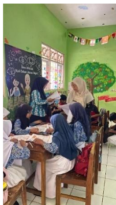
Gambar 11. Penutup

tidak hanya untuk memperdalam penguasaan konsep, tetapi juga untuk membentuk karakter kerja keras melalui proses belajar yang aktif dan kolaboratif.