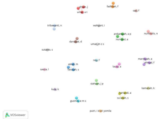
Gambar 3. Visualisasi Jaringan Kerja Sama Penulis pada Penelitian dengan Kata Kunci Transformasi Peran Guru

antarpemulis. Semakin tinggi tingkat keterhubungan kerja sama antarpemulis, maka dapat diindikasikan bahwa penelitian pada topik tersebut semakin solid dan memiliki potensi pengembangan yang besar melalui kolaborasi yang terfokus pada topik yang berkaitan dengan transformasi peran guru. Data yang digunakan dalam analisis ini diambil dari database Google Scholar dan menggunakan basis data yang sama seperti pada analisis co-occurrence sebelumnya. Visualisasi hasil analisis tersebut ditampilkan pada gambar berikut menggunakan software VOSviewer: