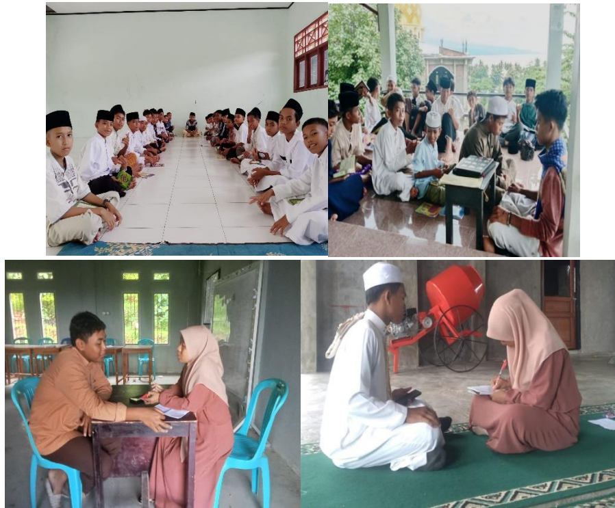
Gambar 1. Kegiatan dalam Proses Menghafal dengan Menggunakan Metode Tasmi', Tafahhum, Tikrar dan Muroja'ah

Meskipun tidak ditemukan penelitian yang spesifik mengenai dampak metode 3T+1M di SMP Islam Tahfidz Qur'an kelurahan Kolo Kota Bima, hasil dari berbagai penelitian diatas menunjukkan bahwa metode 3T+1M memiliki potensi besar untuk meningkatkan kualitas hafalan Al-Qur'an jika diterapkan dengan baik dan di sesuaikan dengan kondisi serta kebutuhan siswa.