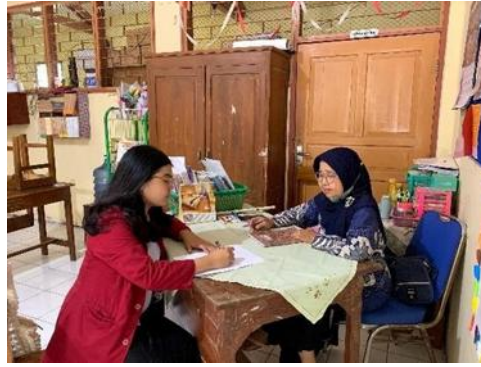
Gambar 1. Kegiatan Observasi dan Wawancara

Tantangan dalam mengimplementasikan nilai-nilai Profil Pelajar Pancasila muncul sebagai salah satu isu penting di SD Negeri Bibisluhur I, yang telah menerapkan Kurikulum Merdeka Belajar. Berdasarkan hasil observasi dan data yang terkumpul, terdapat sejumlah hambatan yang dihadapi oleh para guru, khususnya dalam proses mengintegrasikan nilai-nilai Profil Pelajar Pancasila ke dalam pembelajaran Pendidikan Pancasila antara lain seperti situasi, tantangan, aksi, dan juga refleksi hasil. Situasi yang terjadi di SD Negeri Bibisluhur I dalam Pendidikan Pancasila dengan penerapan Kurikulum Merdeka menghadapi permasalahan utama berupa rendahnya motivasi siswa dalam belajar. Praktik yang diterapkan untuk meningkatkan minat belajar siswa belum berhasil sepenuhnya. Meskipun ada upaya untuk mengidentifikasi dan mengevaluasi metode pembelajaran yang telah dicoba sebelumnya, penggantian pendekatan yang lebih efektif belum memberikan dampak yang signifikan terhadap siswa. Dalam kondisi ini, peran guru sebagai motivator belum sepenuhnya berhasil membangkitkan semangat dan antusiasme siswa, yang membuat proses pembelajaran terasa kurang efektif.